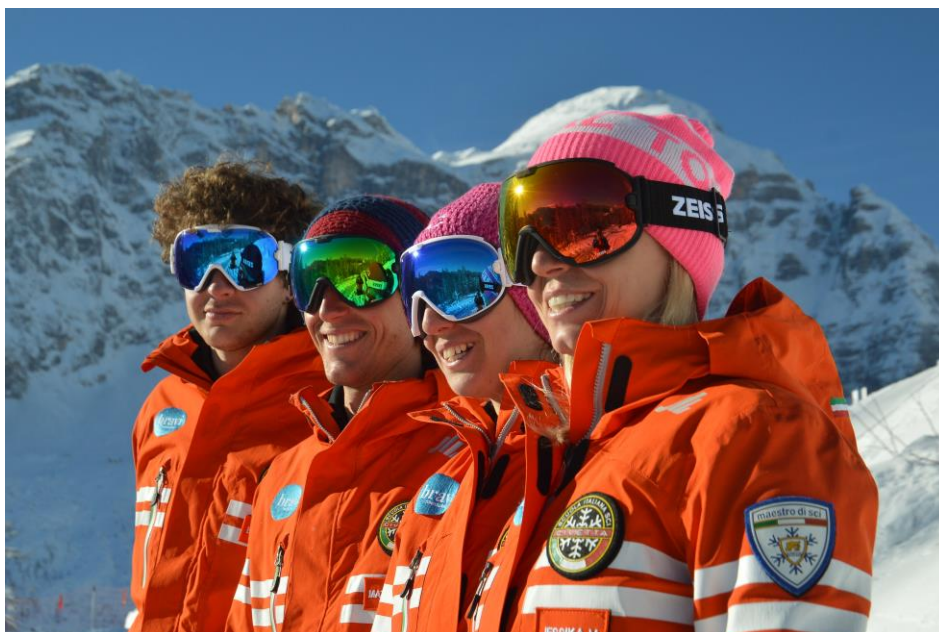
Maestri della Scuola Sci Civetta di Pecol di Zoldo (BL) che hanno provato le maschere Zeiss in anteprima. (In allegato al Comunicato Stampa la fotografia in alta risoluzione)